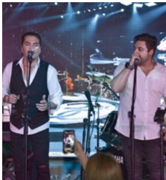
A dupla encantou o público