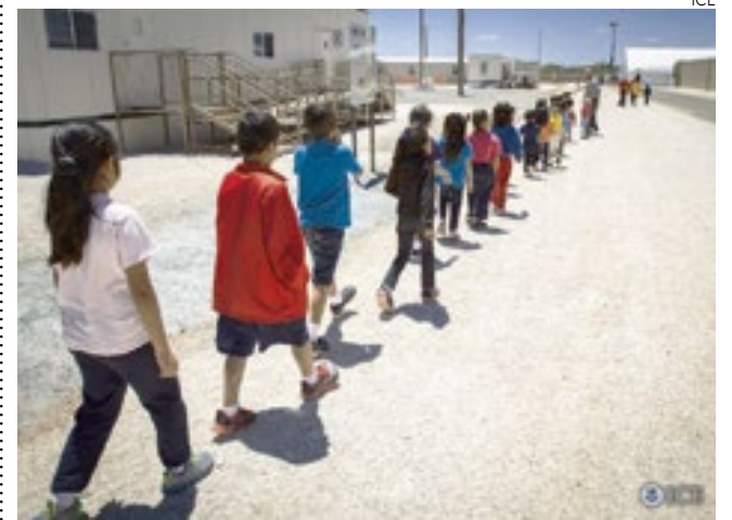
Atualmente, mais de 20 mil delas estão em algum centro de detenção.

Durante março e abril, mais de 36 mil crianças entraram nos Estados Unidos desacompanhadas de um adulto. Um recorde nos últimos anos. Atualmente, mais de 20 mil delas estão em algum centro de detenção pelo país, dos quais pelo menos 13 são novos.