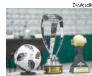
A Florida Cup começa em 25 de julho.

A alta taxa de vacinação nos EUA tem permitido, aos poucos, retomada de eventos esportivos no país.