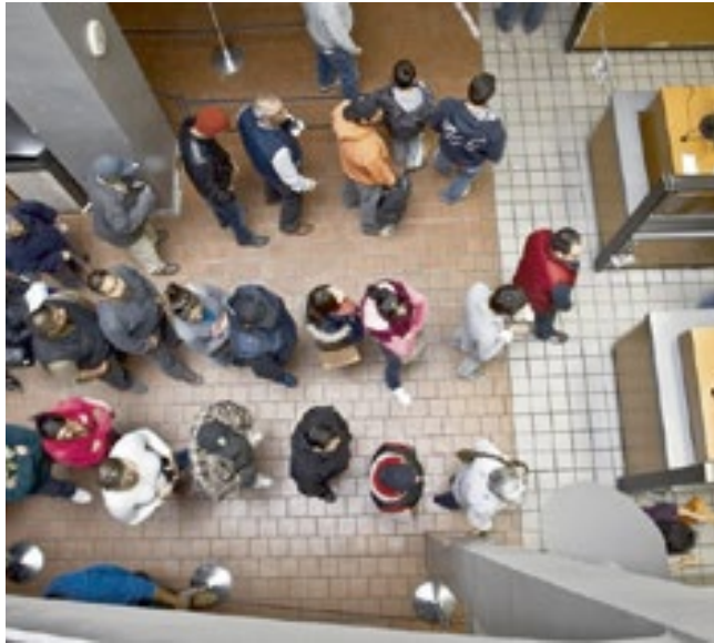
A medida voltaria a permitir entrada de indocumentados adultos.

Nos últimos dias, autoridades de direitos humanos e dois dos próprios consulto-