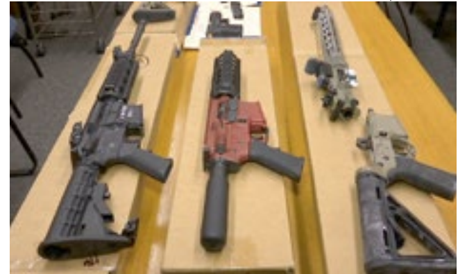
A proposta tornaria mais fácil processos civis contra fabricantes de armas.

Apoiadores do projeto de lei estão tentando combater o fluxo de armas ilegais para