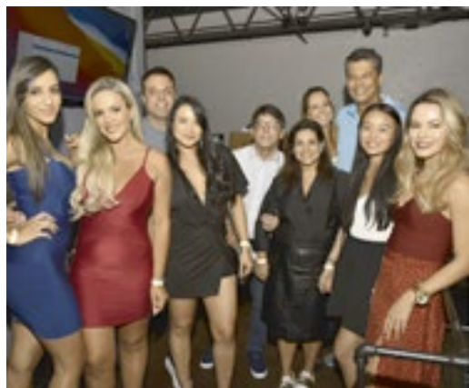
Camarote Q Bonita Boutique