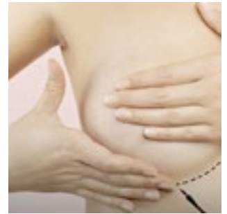
BRCAStrong oferecerá mamografia.

A BRCAStrong, uma organização sem fins lucrativos do sul da Flórida, está ajudando mulheres carentes a fazer mamografias gratuitas.