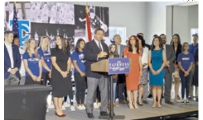
Ron DeSantis com atletas durante o anúncio da lei na terça-feira, 1º.

Mas a legislação assinada pelo governador promove um princípio afirmado pelos apoiadores: diferenças biológicas entre homens e mulhe-