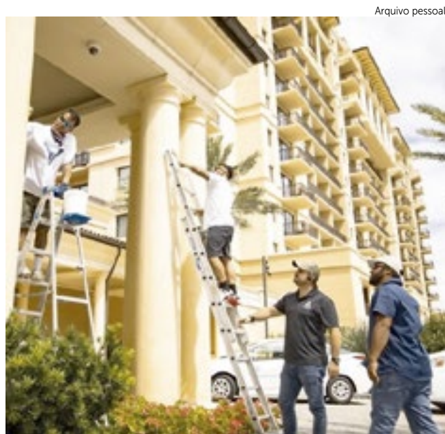
Em reforma de imóveis, há vagas para pintores na The Captain Painter.

O Programa dá às pessoas que estão atualmente desempregadas um pagamento semanal de $ 300 do governo federal, além do pagamento de desemprego do estado - que é um mínimo de $32 e um má-