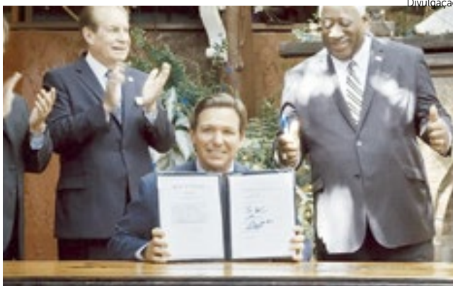
Ron DeSantis assinou o orçamento recorde de US$ 100 bilhões.

O orçamento entrará em vigor em 1º de julho e, em parte, financia o programa de trabalho de US $ 9,44 bilhões do Departamento de Transporte; fornece US $ 75 milhões para a agência de marketing de turismo Visit Florida; fornece US $ 74 milhões para o programa de desenvolvimento econômico do Fundo de Subsídios para o Crescimento do Emprego; e aumenta para US $ 13 por ho-