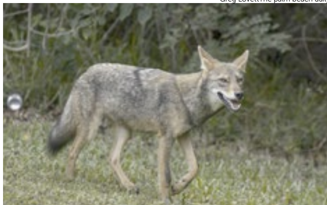
Assim como outros animais selvagens, os coiotes são comuns na Flórida.

O animal teve sorte porque os ferimentos da mordida