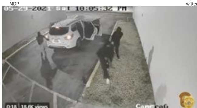
Vídeo mostra o momento em que o trio chega armado com rifles.

O tiroteio começou pouco depois da meia-noite, disse o diretor da Polícia de Miami-Dade Alfredo “Freddy” Ramirez, quando três atiradores armados com revólveres e rifles semiautomáticos saíram do Nissan e dispararam dezenas de balas “indiscriminadamente” contra uma multidão que estava em um show de rap do lado de fora do El Mula Banquet Hall, próximo ao Country Club de Miami.