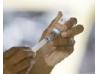
Brasil terá mais doses.

A Fundação Oswaldo Cruz (Fiocruz) adiantou na quarta-feira, 2, que a produção do Ingrediente Farmacêutico Ativo (IFA) nacional deve permitir a entrega de 50 milhões de doses da vacina contra covid-19 em 2021. Segundo a fundação, foi firmado novo acordo com a AstraZeneca para a importação de IFA suficiente para mais 50 milhões de doses, somando 100 milhões de doses a serem entregues no segundo semestre.