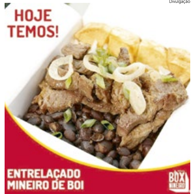
Com pratos típicos da culinária mineira, a loja vem conquistando clientes.

Pensando assim, abriu o negócio para franqueados. “É uma responsabilidade muito grande manter a qualidade, o padrão. Porque não é só vender comida. É vender uma boa experiência para o cliente. Comer é um momento prazeroso e queremos sempre proporcionar isso ao nosso consumidor”, salienta Souza.