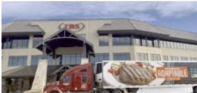
As redes de computadores da JBS foram hackeadas afetando operações.