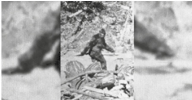
Vários estados afirmam ser a casa do BigFoot após avistamentos.

Uma equipe de filmagem documentará as tentativas.