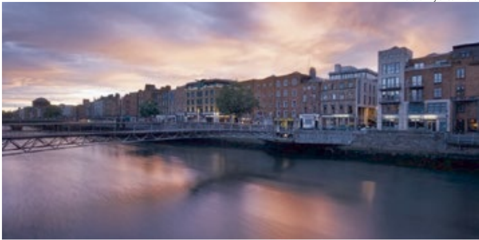
Dublin, capital da Irlanda, é um dos lugares que brasileiros podem visitar seguindo medidas preventivas.

Para acessar qualquer país que pertence à União Europeia, é preciso embarcar com uma companhia que autorize o embarque de brasileiros em seus voos, ainda que façam conexões em países bloqueados (França, Alemanha, Suíça e Holanda). São elas: Lufthansa, Swiss, KLM e Air France.