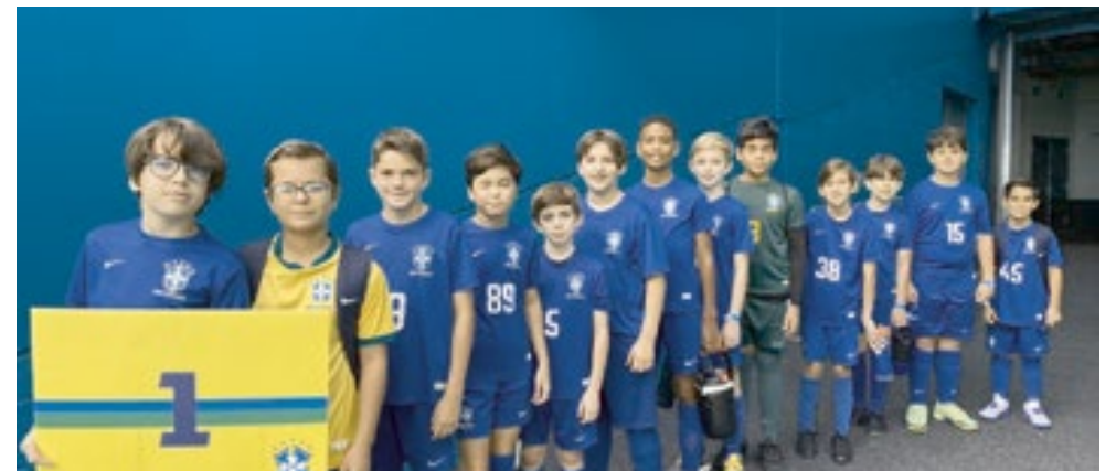
A turma do "Soccer Recreativo"