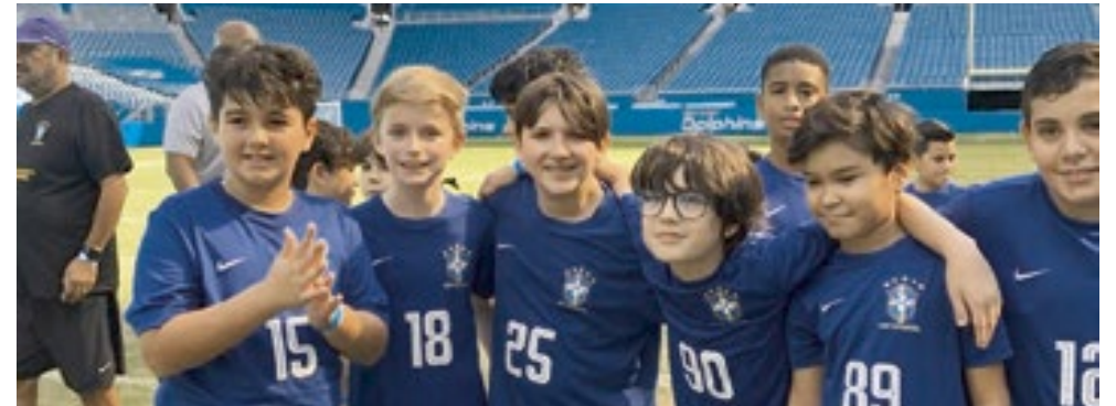
Confraternização após o amistoso

Os treinos acontecem na "West Boca Raton Community High School" com horários e programas diferentes de segunda a sexta, a partir das 5:00pm. Soccer Competitivo: segunda, quarta e sexta das 6:00pm as 7:30pm; Soccer recreativo: segunda e quarta ou terça e quinta de 5:30pm as 6:30pm. Informações +1 321-263-1022