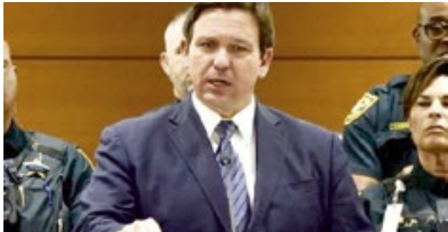
Governador Ron DeSantis decidiu reforçar a segurança em Florida Keys.