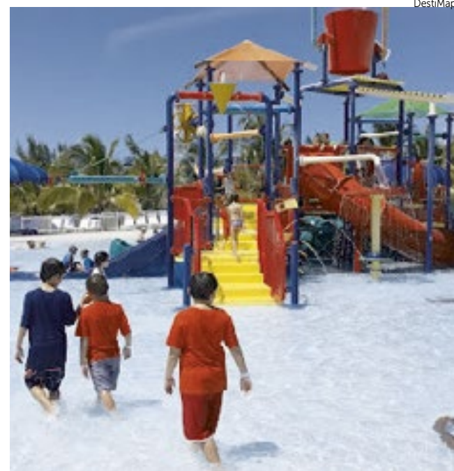
Broward ficou no 3º lugar geral, Palm Beach em 9º e Miami em 22º.