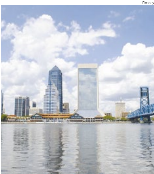
Jacksonville é a quarta maior região metropolitana da Flórida.