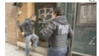
Agentes do ERO durante operação.

Funcionários da Imigração e Alfândega disseram que sua carga de trabalho de imigração civil “aumentou significativamente” no ano fiscal passado, em grande parte devido