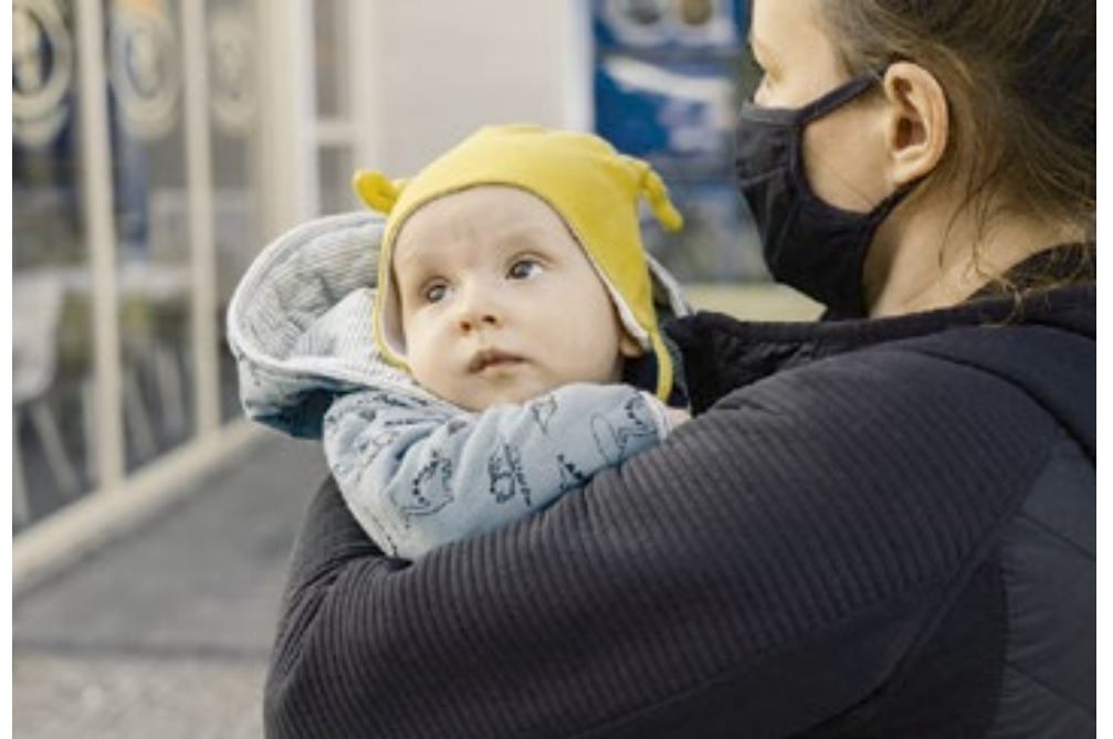
Durante a pandemia, famílias decidiram se beneficiar do custo mais baixo de moradia fora das grandes cidades.

“Ainda é uma questão muito aberta, se esse êxodo