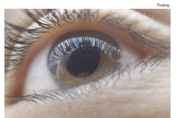
Se não tratado, o glaucoma pode causar perda de visão e cegueira.

- O glaucoma pode causar perda de visão e cegueira, que não podem ser revertidas. O