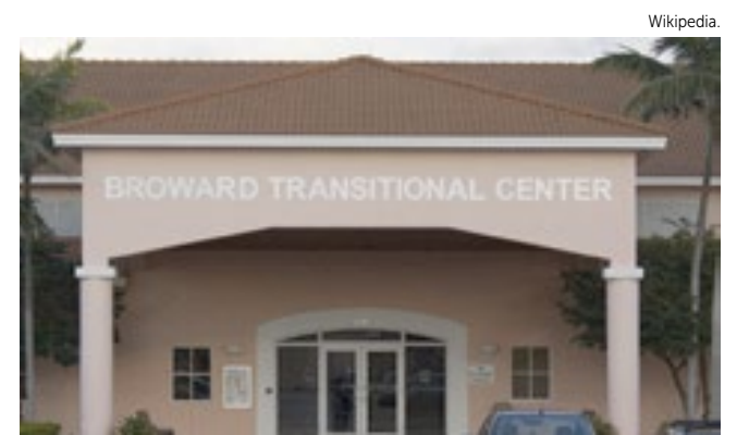
Imigrantes deixaram a custódia da imigração no Broward Transitional Center.

Mas enquanto ela foi libertada após o processo de imigração, ele foi detido. Na quinta-feira, eles finalmente se reuniram depois que ela passou meses imaginando o