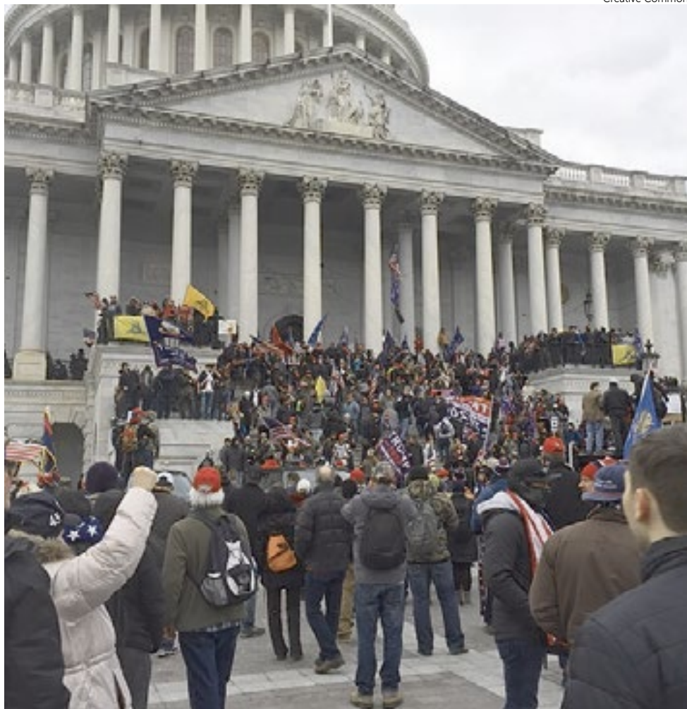
Manifestantes invadiram o Capitólio em 6 de janeiro de 2021 quando da confirmação da eleição presidencial.

sem reservas a suspensão de 90 dias do cargo imposta pelo ministro Alexandre de Moraes, do STF.