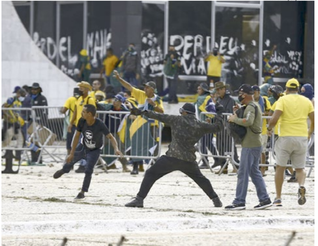
Manifestantes invadiram o prédio do Congresso Nacional, Supremo Tribunal Federal e o Palácio do Planalto no dia 8 de janeiro de 2023.

Sabatini observa que até mesmo o governador do Distrito Federal, Ibaneis Rocha (MDB) — aliado do ex-presidente Jair Bolsonaro — acatou