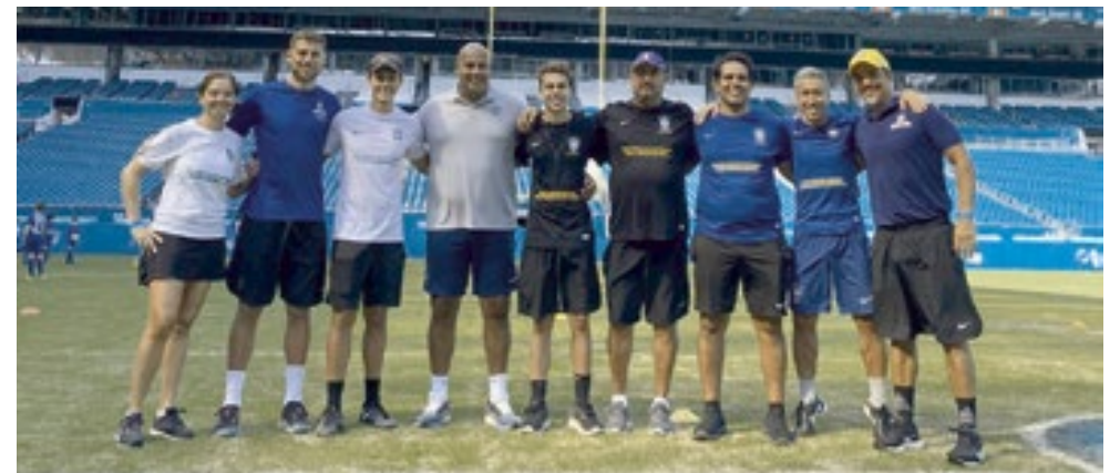
Equipe de treinadores e diretoria da CBF Boca Raton