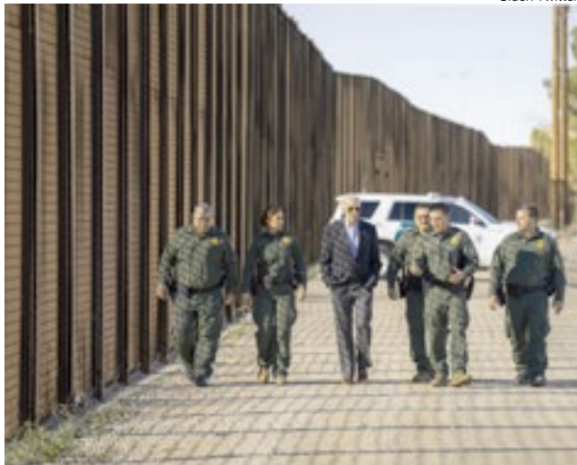
Biden visitou locais mais movimentados pela travessia em El Paso, Texas.

Em uma breve visita ao cruzamento mais movimentado de El Paso e a um centro de apoio a serviços imigrantes, Biden cedeu às exigências de republicanos para que fizesse a viagem que não fazia há dois anos. Mas, ao chegar a