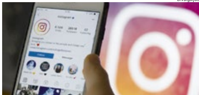
Projeto visa orientar alunos sobre o uso seguro de redes sociais.