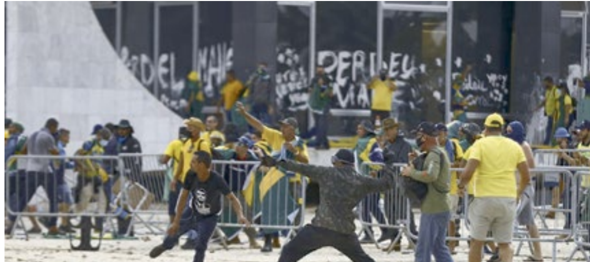
Manifestantes invadiram o prédio do Congresso Nacional, Supremo Tribunal Federal e o Palácio do Planalto no dia 8 de janeiro de 2023.