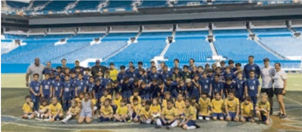
Escolinha de Futebol da CBF Boca Raton