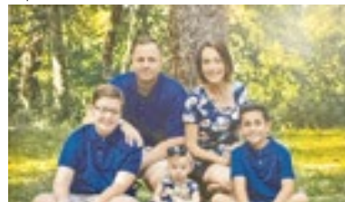
Mais brasileiros optam pela cidade ao norte.