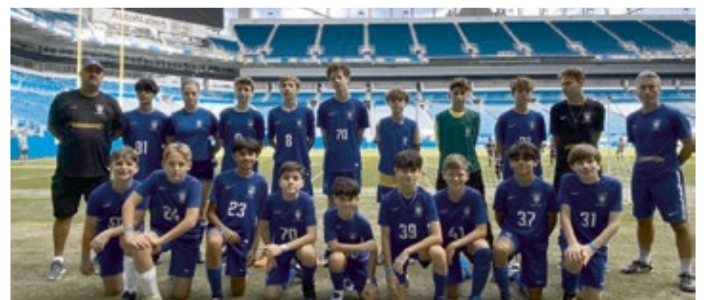
A turma do "Soccer Competitivo"