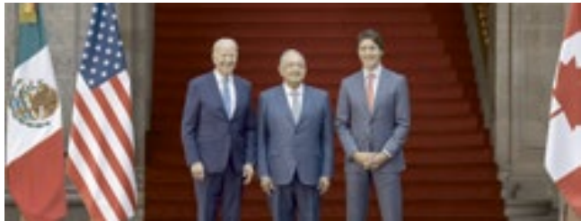
Joe Biden, Andrés López Obrador e Justin Trudeau na Cúpula no México.

A Casa Branca anunciou novos acordos entre Estados Unidos, México e Canadá na terça-feira, 10. Os líderes dos países - os chamados “Três Amigos” - se reuniram para negociações trilaterais sobre imigração e desenvolvimento da América do Norte na Cida-