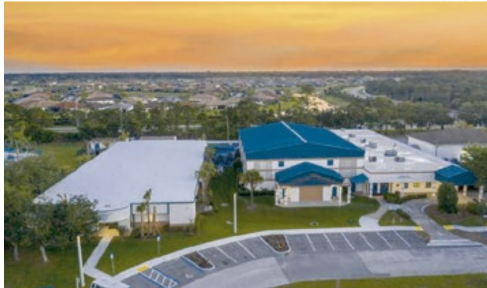
Gifford, no condado de Indian River, possui cerca de 4.481 habitantes e a taxa de pobreza local é de 48,6%.

Dada a baixa renda, não surpreende que uma parcela maior do que a média dos residentes viva na pobreza. Com cerca de 4.481 habitantes em 2020, a taxa de pobreza local na cidade é de 48,6%, em com-