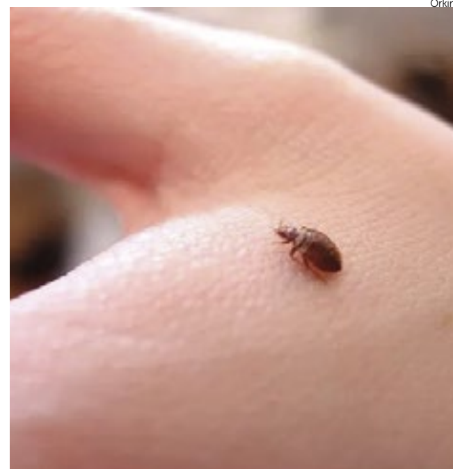
No país, Chicago, Nova York e Filadélfia possuem mais percevejos.

Leia a matéria completa no gazetanews.com