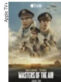
Masters of the Air Apple TV+

do na vida da infame traficante colombiana, a série acompanha a história de Griselda Blanco uma poderosa chefe do narcotráfico conhecida por suas atitudes violentas e impiedosas. Blanco foi responsável por mais de duzentos homicídios enquanto comandava as operações de transporte de drogas entre a Colômbia e Miami e se tornou a primeira mulher criminosa a ficar bilionária. No elenco estão Sofia Vergara, Alberto Guerra, Christian Tappan, Vanessa Ferlito, entre outros.