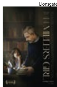
Miller's Girl

O drama "Miller's Girl" com a atriz Jenna Ortega entra em cartaz nos cinemas no dia 26 de janeiro.