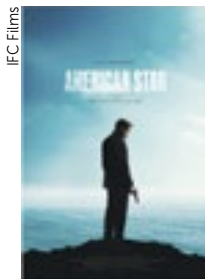
American Star IFC Films