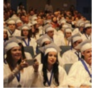
88% se formaram em 2023.

O Departamento de Educação da Flórida estabeleceu um novo recorde de formandos do ensino médio no ano letivo de 2022-2023.