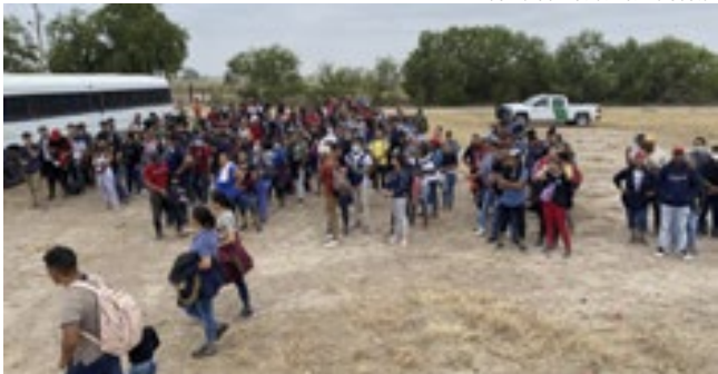
Imigrantes são levados pela Patrulha da Fronteira em Del Rio, Texas.