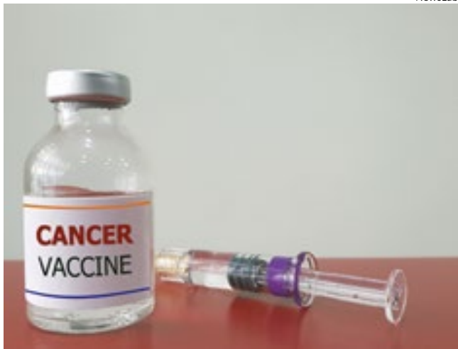
A vacina pode estimular o sistema imunológico a combater o câncer.