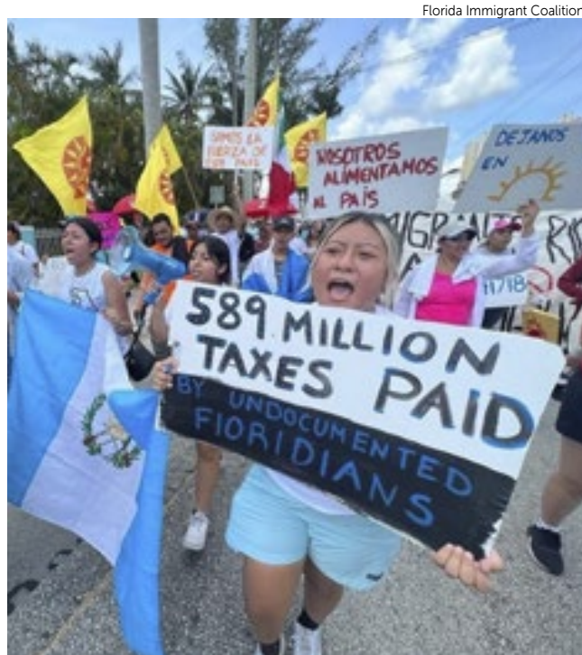
Em 2021, imigrantes indocumentados representavam 4,1% da população.

Dos 10 estados que viram a população infantil e adolescente aumentar durante esse período, 62% do ganho total da população infantil ocorreu no Texas e na Flórida. A Flórida ganhou 42.370 crianças menores de 18 anos, de acordo com a análise de dados do censo feita pelo demógrafo da Brookings Institution, Wil-