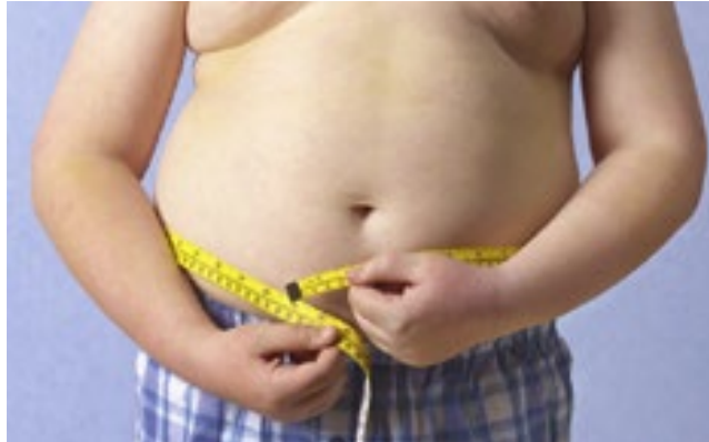
O índice de obesidade infantil aumentou em 2023.

“Nas áreas urbanas e rurais, não há alimentos acessíveis e de alta qualidade para muitas pessoas. Eles eram