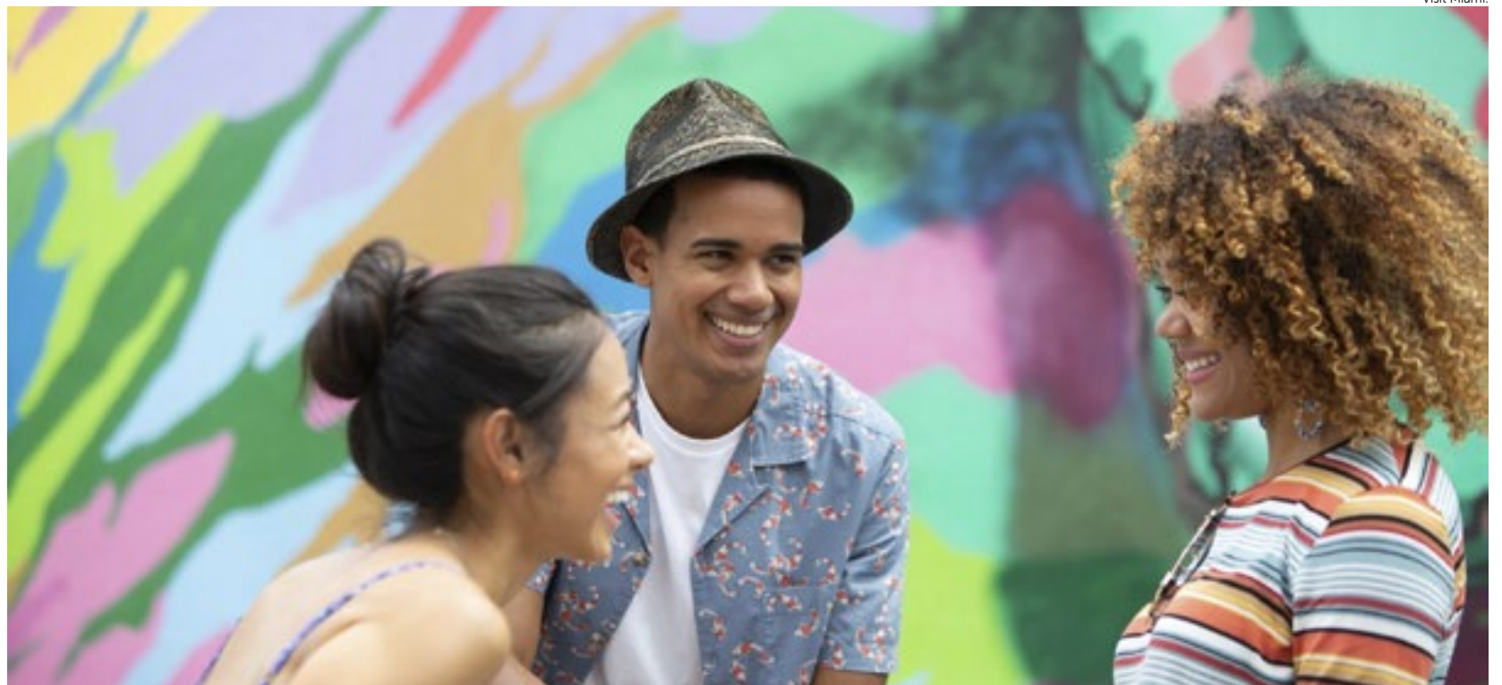
A Flórida vem ganhando sua população infantil por meio de novos residentes e imigrantes, mostra análise do censo. Foram 42.370 novos moradores menores de 18 anos entre 2020 e 2022.

“Nacionalmente, a imigração é a chave para o crescimento da população mais jovem”, disse o demógrafo William Frey.