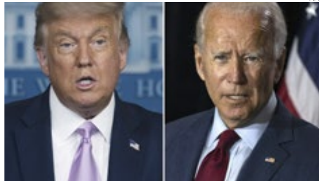
Donald Trump e Joe Biden podem disputar novamente a Casa Branca.

a maioria dos eleitores das primárias republicanas querem dar a Donald Trump ou-