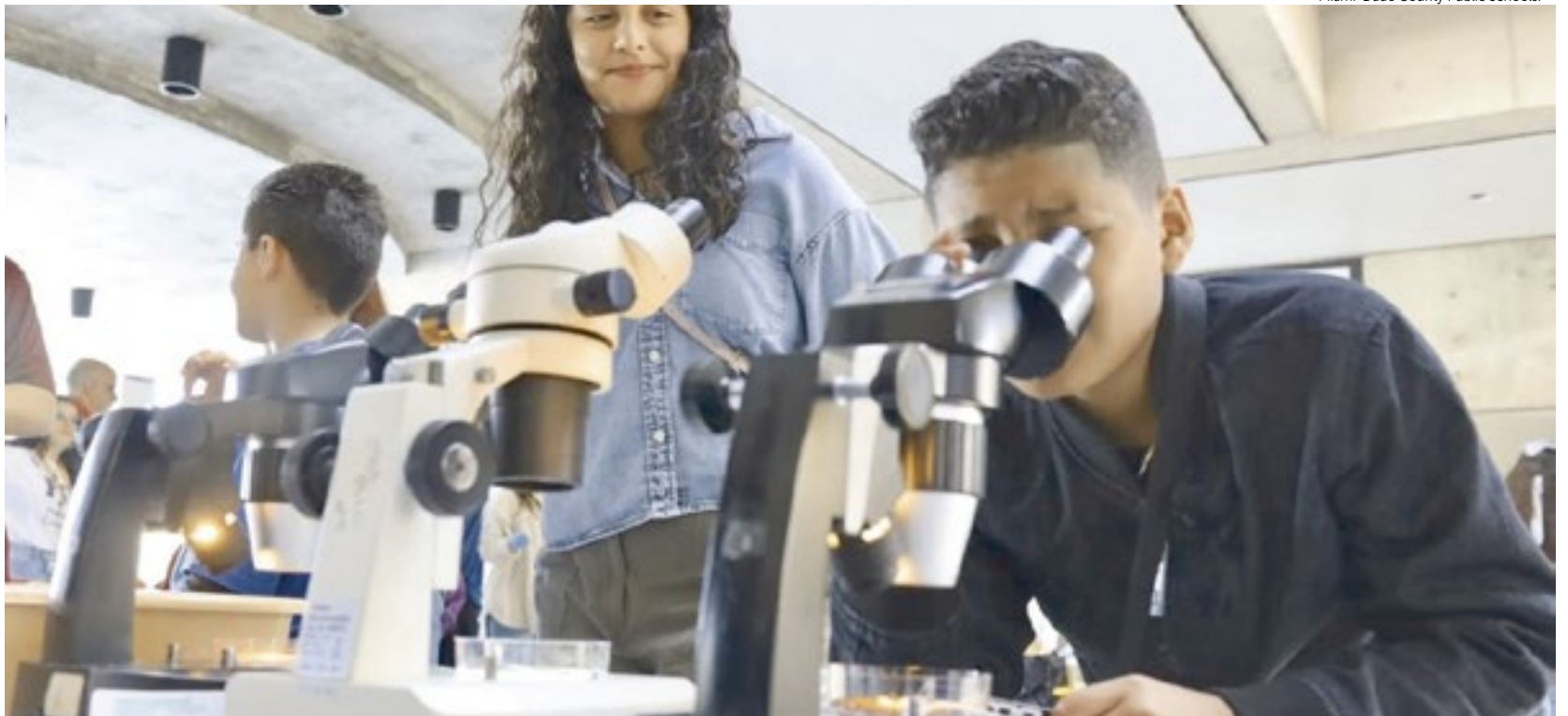
O Sunshine State ficou em 11º lugar geral na pesquisa do WalletHub, classificado em oitavo lugar na categoria segurança e 11º lugar na categoria qualidade.

“Obter financiamento suficiente é essencial para um sistema escolar produtivo, mas simplesmente ter mais dinheiro não garante o sucesso”, disse Cassandra Happe, analista da WalletHub, no estudo.