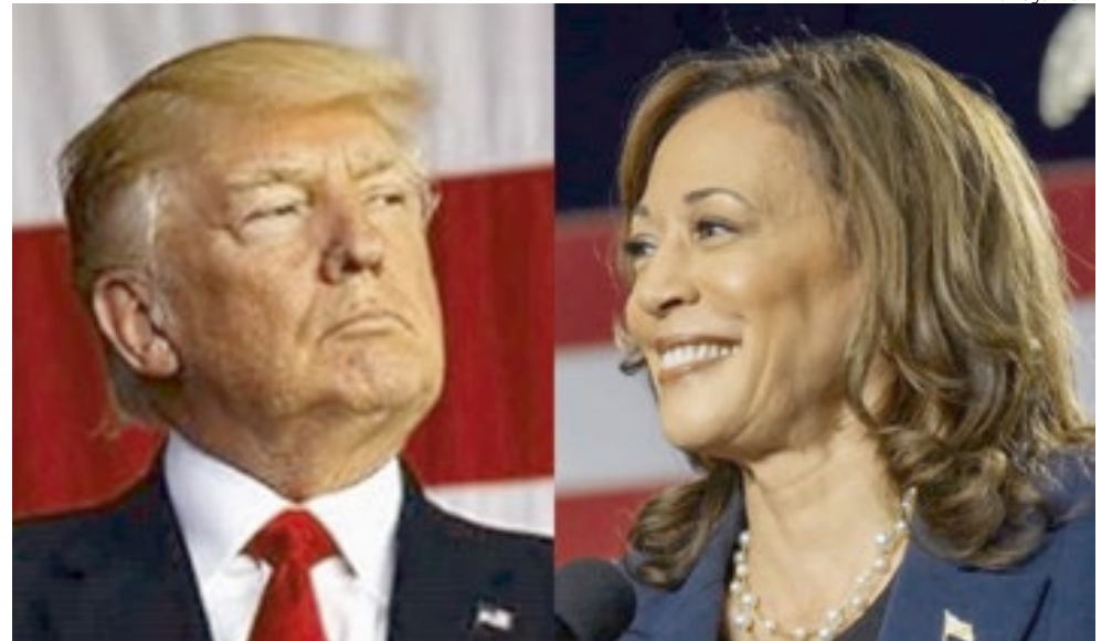
Com a desistência de Joe Biden, Donald Trump deverá enfrentar Kamala Harris nas urnas no dia 5 de novembro.

Já Trump e a sua campanha estão trabalhando para reimaginar um manual e uma operação lançados para enfrentar Biden. Trump reagiu