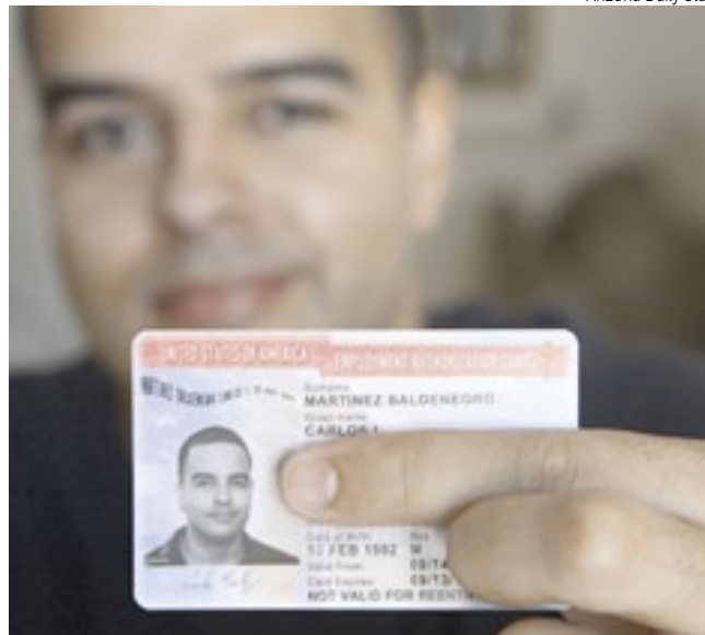
Em 2022, 49% dos imigrantes eram naturalizados e 24% tinham green card.

Em 2022, mais de 30 milhões de imigrantes faziam parte da força de trabalho dos EUA. Os imigrantes legais constituíam a maior parte da força de trabalho migrante, com 22,2 milhões. Outros 8,3 milhões de trabalhadores imigrantes não estão autorizados. Este é um aumento notável