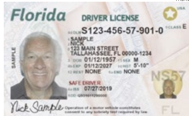
A mudança se aplicará para renovação, substituição ou primeira licença.

O formato permanecerá o mesmo, mas a nova versão irá melhorar a segurança e proteger as identidades”, disse o FHSMV.