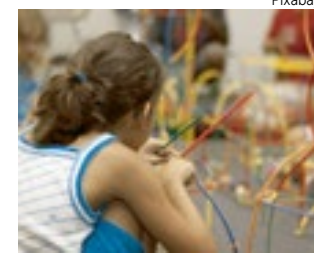
A Residing Hope é um lar temporário.