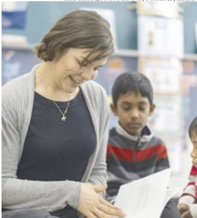
Massachusetts é o estado número 1, com o melhor sistema escolar do país.

Massachusetts Department of Elementary and Secondary Education.