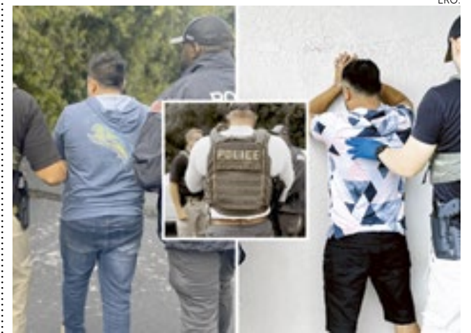
Vários possuem histórico criminal e estavam soltos sob condicional.

Agentes de imigração em Miami prenderam 18 imigrantes indocumentados suspeitos de vários crimes, incluindo agressões e posse de drogas.