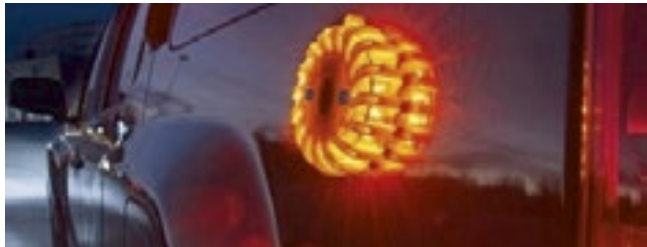
As luzes serão dadas aos motoristas que precisarem de assistência.

A Central Florida Expressway Authority (CFX) vai distribuir luzes de emergência gratuitas nas estradas aos motoristas para promover a segurança nas estradas.