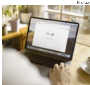
Google é acusada de monopólio através de mecanismo de busca