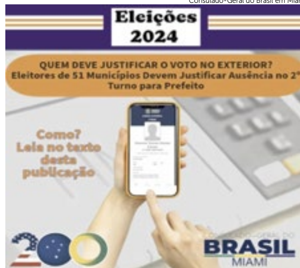
Consulado-Geral do Brasil em Miami

Prazo: Justifique até 60 dias após a eleição (ou seja, até o final de janeiro de 2025). Evite multas e mantenha sua situação eleitoral regularizada!