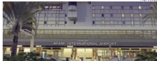
Miami International Airport (M.I.A.)