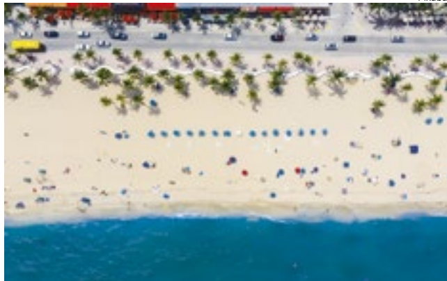
Fort Lauderdale, Florida

Este enorme fluxo de pessoas para a Flórida deve impulsionar o PIB do estado e o crescimento de empregos. No entanto, com mais pessoas se