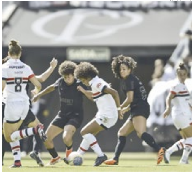
Fifa anuncia novas competições do futebol feminino

rá em 2026, entre 28 de janeiro e 1º de fevereiro. A competição ocorrerá em anos em que não houver o Mundial de Clubes Feminino. Sendo assim, já es-