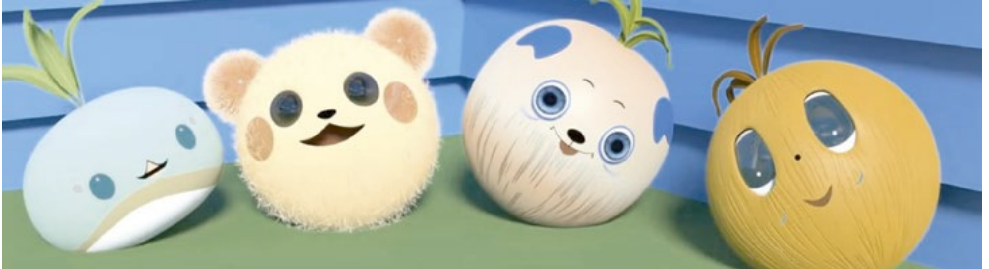
Os quatro cocos da Coconuts Nuts