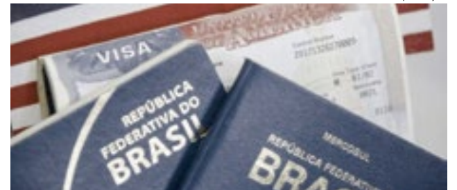
Em oito meses foram emitidos 2 mil vistos EB-1 e EB-2 para brasileiros

O visto B1/B2, voltado para turismo e negócios, liderou amplamente as emissões, com 356,9 mil documentos — cerca de 94% do total. Em seguida, aparecem o J-1 (intercâmbio), com 3,5 mil concessões, e o F-1 (estudos), com 2,5 mil. Apesar da política migratória mais rígida do governo Trump, o interesse por estudos nos EUA se manteve: o visto F-1 cresceu 7,2% no acumulado do ano, e o J-1 teve alta em maio, embora com queda