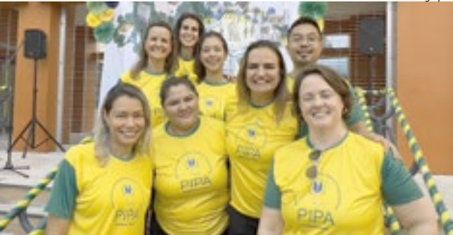
PIPA (Portuguese International Parents Association)

No dia 5 de setembro, a escola Ada Merritt promoveu uma celebração em homenagem ao Dia da Independência do Brasil, reunindo seus alunos brasileiros em um momento especial de cultura e patriotismo. Reconhecida por seu compromisso com a valorização da língua portuguesa e da cultura brasileira, a escola — premiada por essa iniciativa — faz questão de celebrar, todos os anos, datas significativas para a comunidade, mantendo vivas as tradições e raízes de seus estudantes. A comemoração contou com apresentações, atividades culturais e, claro, muita alegria!