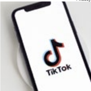
TikTok pode ser banido dos EUA a partir de 2025