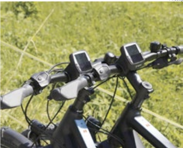
Maiores de 16 anos podem andar de e-bike sem licença atualmente

embora incluir o tema no exame de motorista seja positivo para melhorar a convivência no trânsito, exigir licença para bicicletas elétricas mais rápidas pode restringir o acesso e equiparar o uso desses veículos