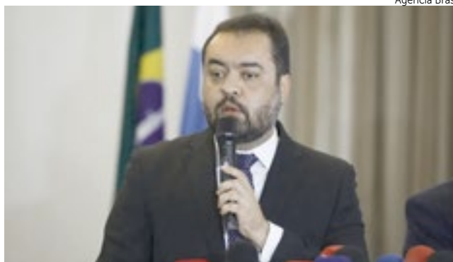
Cláudio Castro (PL) é Governador do Rio de Janeiro

Apesar do avanço das articulações, o governo Lula trata a proposta com cautela. Auxí-