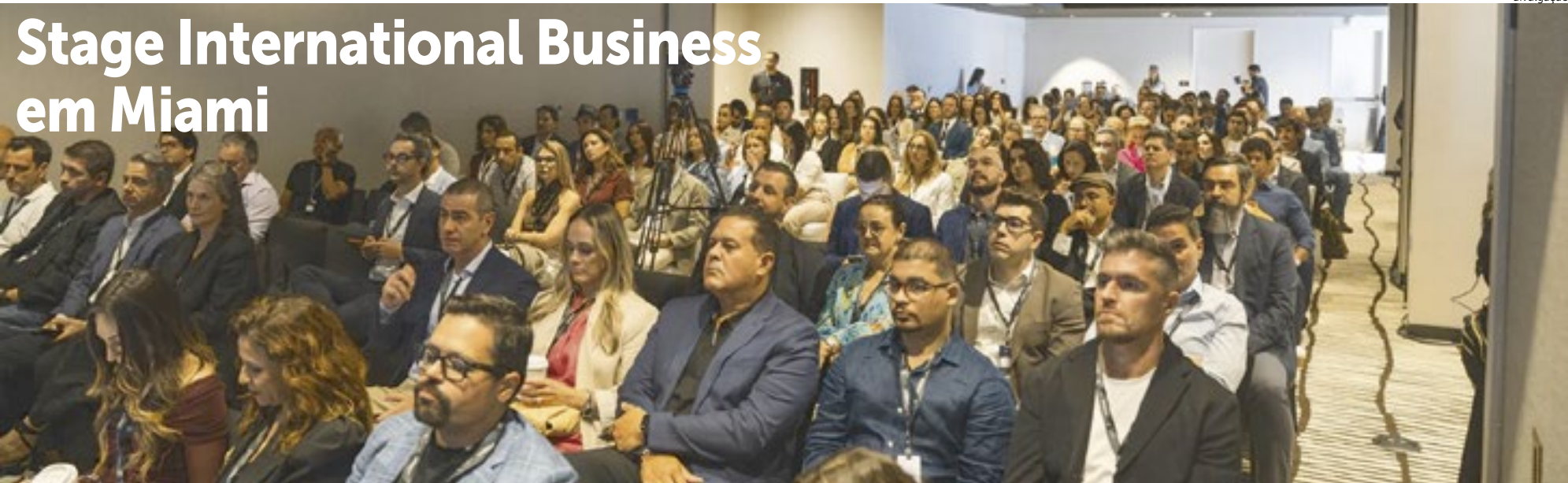
Mais de 250 empreendedores reunidos