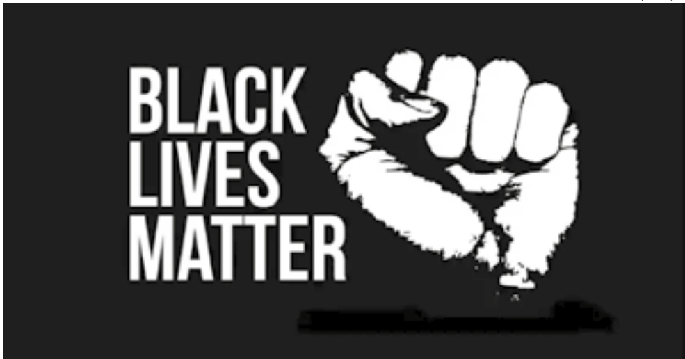
Departamento de Justiça dos EUA investiga fundação Black Lives Matter por possível uso indevido de doações

O Departamento de Justiça dos Estados Unidos abriu uma investigação sobre o uso de doações pela Black Lives Matter Global Network Foundation, organização ligada ao movimento antirracista, segundo uma fonte com conhecimento do caso. A apuração busca determinar se os recursos arrecadados durante os protestos de 2020 — que eclodiram após a morte de George Floyd — foram utilizados de forma indevida pela liderança do grupo.