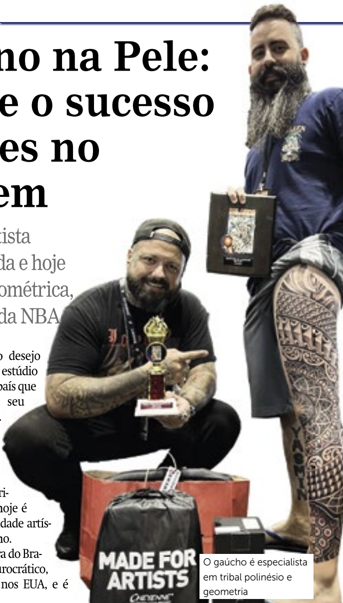
O gaúcho é especialista em tribal polinésio e geometria

res já alimentava o desejo de abrir seu próprio estúdio nos Estados Unidos, país que sempre considerou seu “país dos sonhos”. Após anos de dedicação e aprendizado, fundou o Torres Tattoo Studio, em Pompano Beach, na Flórida, um espaço que hoje é referência pela qualidade artística e profissionalismo. “Empreender fora do Brasil é muito menos burocrático, especialmente aqui nos EUA, e é