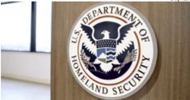
Department Of Homeland Security

disputa entre duas alas internas: de um lado, o diretor do ICE, Todd Lyons, e o “Czar da Fronteira” Tom Homan, que defendem focar em imigrantes com antecedentes criminais ou ordens de deportação já emitidas; do outro, a secretária do DHS, Kristi Noem, e aliados como Corey Lewandowski e Greg Bovino, que pressionam por uma abordagem mais ampla e agressiva, mirando qualquer pessoa em situação irregular no país. Fontes descrevem o clima no departamento como “tenso” e “combativo”, com parte da liderança do ICE alertando que o novo modelo pode minar o apoio público e confundir os papéis entre o ICE e a Patrulha de Fronteira. Um funcionário relatou que, desde a chegada dos agentes de fronteira a Los Angeles em