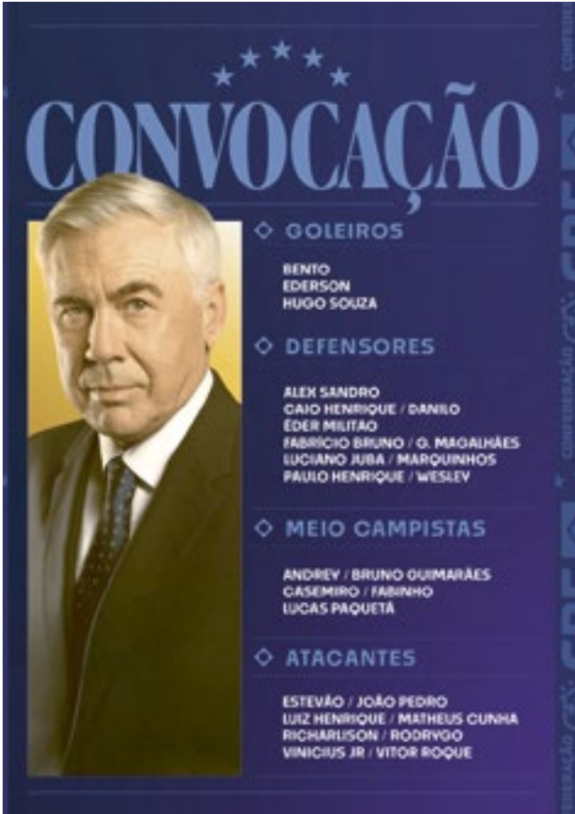
Lista de convocados de Ancelotti

ra o Mundial de 2026, no Canadá, México e Estados Unidos. Em março, a seleção fará dois amistosos contra equipes europeias, ainda não definidas, nos Estados Unidos. A última Data Fifa ocorrerá junho, no Brasil. A Amarelhinha treinará na Granja Comary e a CBF planeja realizar um último amistoso antes da Copa no país. O adversário será escolhido após o sorteio dos grupos do Mundial, no dia 5 de dezembro. Durante a entrevista na CBF, após o anúncio dos convocados, Ancelotti disse que ainda não escolheu os 17 ou 18 jogadores que certamente farão parte da lista definitiva para o Mundial. Acredito que quanto mais tempo passo com os jogadores, mais próximos estamos do que pode ser a lista definitiva. Tem mais ou menos seis meses, tem uma Data fifa mui-