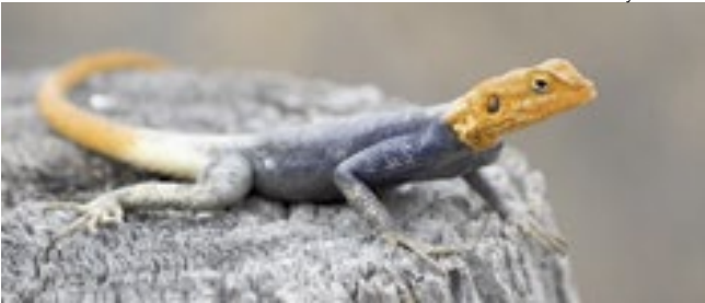
Lagarto Peter's rock agama