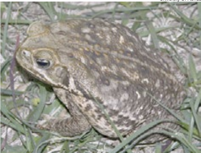
Sapo Bufo, conhecido como Cane Toad

O perigo maior está no veneno altamente tóxico que esses sapos liberam pela pele, capaz de matar cães e gatos em minutos se ingerido. Segundo a Comissão de Conservação de Peixes e Vida Selvagem da Flórida (FWC), o contato com