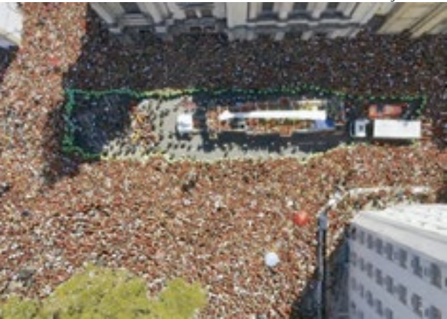
Jogadores desfilaram em trio elétrico pelo centro da cidade

Após a vitória por 1 a 0 sobre o Palmeiras, em Lima, no Peru, o Flamengo se tornou o 1º clube brasileiro a conquistar 4 troféus da Libertadores (1981, 2019, 2022 e 2025),