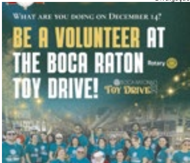
Boca Toy Drive

No dia 14 de dezembro, das 10h às 15h, acontecerá o “Boca Raton Toy Drive” no Sugar Sand Park (300 S. Military Trail). A organização do evento está em busca de voluntários para receber as famílias e ajudar na organização dos brinquedos doados. Se você deseja participar dessa campanha tão especial e solidária, entre em contato! Inscreva-se para ser voluntário: https://bocaratontoydrive.com #BocaToyDrive #VolunteerWithUs #GiveBack #CommunitySpirit