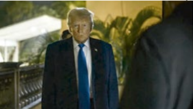
Presidente dos Estados Unidos, Donald Trump

Medida é anunciada após ataque em Washington, D.C.