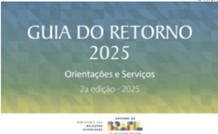
Consulado Geral do Brasil em Miami

O Ministério das Relações Exteriores acaba de lançar a edição 2025 do Guia do Retorno, um material atualizado com tudo o que brasileiras e brasileiros precisam saber ao decidir voltar ao país depois de um período no exterior. Nos últimos anos, cresceu o número de migrantes retornando ao Brasil — seja pela mudança nas políticas migratórias em outros países ou pela melhora do mercado de trabalho brasileiro. Para apoiar esse movimento, o Guia traz orientações práticas