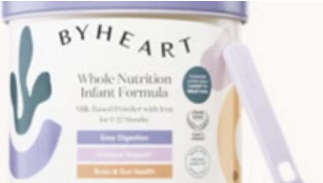
EUA recolhem fórmula infantil após surto de botulismo

bactéria pode se distribuir de forma irregular no pó, o que significa que nem todos os bebês expostos adoecem. Mesmo após o recall nacional emitido no início do mês, a FDA relatou, em 20 de novembro, que produtos da ByHeart ainda eram encontrados à venda em grandes varejistas. A empresa afirmou que reembolsará totalmente todas as compras feitas em seu site a partir de 1º de agosto e que segue investigando a origem da contaminação. O processo inclui auditoria completa da cadeia de produção — desde fornecedores e ingredientes até embalagem e transporte — e a testagem de novas amostras. Pais de bebês afetados já ingressaram com ações judiciais contra a ByHeart. As duas primeiras ações, apresentadas no início do mês, acusam a empresa de negligência ao vender um produto defeituoso e pedem compensação por gastos médicos, danos emocionais e outras perdas. Fonte: CBS