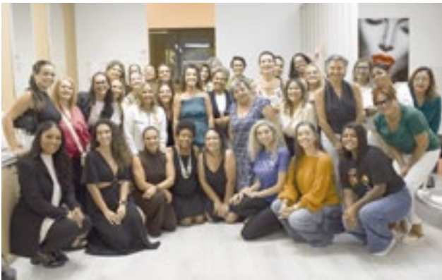
Mulheres que fazem a diferença!