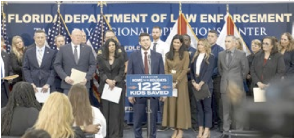
Autoridades anunciam resgate de crianças

No total, foram encontradas 57 crianças na região de Tampa Bay, 14 em Orlando, 22 em Jacksonville e 29 em Fort Myers. Também houve resgates em outros nove estados, embora os números ainda não tenham sido divulgados. Durante a operação, seis pessoas foram presas, algumas acusadas de crimes graves, incluindo abuso sexual infantil e interferência de custódia. As identidades dos suspeitos não foram divulgadas. As autoridades informaram