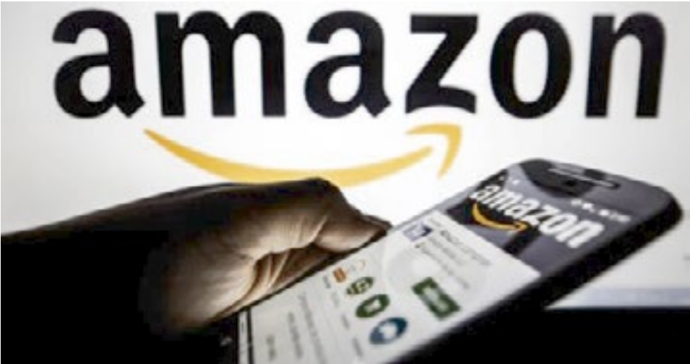
Decisão vale para clientes inscritos nos últimos 6 anos

so os clientes que assinaram o Prime entre junho de 2019 e junho de 2025 e usaram os benefícios do serviço menos de três vezes ao ano. Os pagamentos — de até US$ 51 — começarão a ser enviados