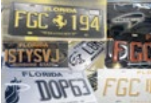
Placas de veículos personalizadas da Flórida

rentes ou fumê, luzes ou dispositivos refletivos instalados sobre a placa, além de mecanismos que permitem ocultá-la, virá-la ou trocá-la. As autoridades orientam motoristas a manterem a placa limpa, visível e totalmente desobstruída. Também recomendam verificar molduras instaladas por concessionárias, retirar acessórios estéticos e garantir que a iluminação da placa esteja funcionando. As punições variam conforme a infração. Modificar, cobrir ou alterar a placa agora é considerado delito de segundo grau, com pena de até 60 dias de prisão e multa de US$ 500. Comprar ou portar dispositivos usados para ocul-