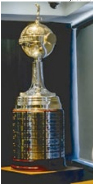
Troféu da Libertadores

Em número de campeões, o Brasil lidera com folga. São 12 clubes diferentes a terem erguido a taça, com o Rubro-Negro assumindo o posto de maior vencedor do país com o título em Lima. Na Argentina, são oito equipes. Apenas Peru, Bolívia e Venezuela nunca tiveram um time que conquistou a América, sendo que somente os peruanos já estiveram em finais. Em 1972, o Universitario foi derrotado pelo Independiente, enquanto em 1997 o Sporting Cristal foi vice para o Cruzeiro.