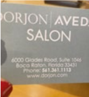
Salão onde a brasileira trabalha há 24 anos

se apenas: “Amanhã você vai lá.” Esse gesto mudou tudo. A então assistente retomou os estudos, encarou provas, longas ho-