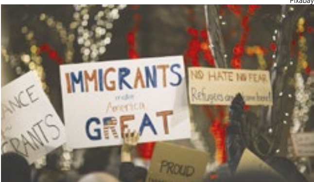
Governo voltou a colocar o tema “public charge” no centro do debate migratório

grantes de baixa renda evitaram serviços médicos por receio das consequências migratórias. Outro estudo da George Washington University apontou aumento das desigualdades raciais em hospitalizações e mortes durante a pandemia devido ao medo de acessar serviços de saúde. Hospitais e especialistas em saúde pública alertam que a nova versão pode repetir — ou ampliar — esses efeitos. Caso imigrantes deixem de usar Medicaid, programas de prevenção e exames básicos, a consequência pode ser um aumento de emergências, sobrecarga de pronto-socorros e disseminação de doenças que poderiam ter sido controladas. A proposta surge em um momento em que o governo Trump e republicanos no Congresso intensificam discursos que associam falsamente imigrantes a abuso de programas sociais. Dados oficiais mostram que pessoas sem status legal não têm acesso a Medicaid, SNAP, marketplace de saúde ou outros benefícios federais.