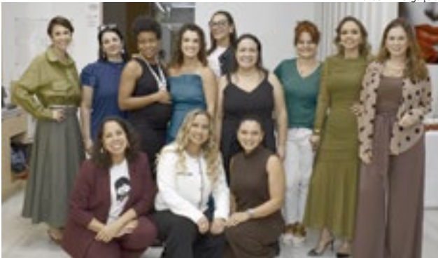
Grupo "Mulheres Virtuosas"