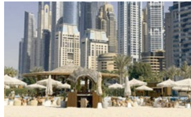
A alta temporada ocorre entre novembro e março, quando as temperaturas ficam entre 15°C e 25°C