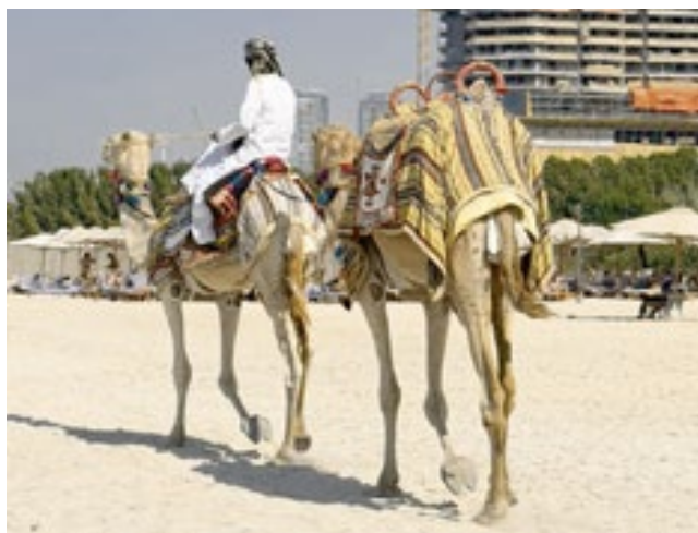
Mesmo com fama de destino luxuoso, os Emirados oferecem opções para diferentes bolsos

A agência EMIRA Tours tem se destacado em Dubai e Abu Dhabi como uma das principais empresas especializadas em atender visitantes de todas as partes do mundo