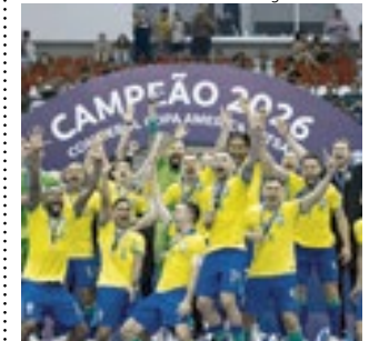
Brasil derrotou Argentina por 2 a 1