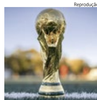
Troféu Copa do Mundo de Seleções da Fifa

O Aeroporto Internacional de Miami, porta de entrada para visitantes internacionais, passa por melhorias para receber aproximadamente 1 milhão de viajantes durante o evento. Novas esteiras rolantes estão sendo instaladas, equipes de manutenção intensificaram os trabalhos e áreas como o setor de retirada de bagagens estão sendo revitalizadas com imagens da cidade.