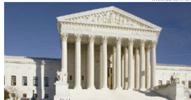
Suprema Corte dos EUA

Mas juizes como John Roberts e Elena Kagan desafiaram a leitura apresentada,