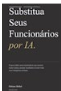
Substitua seus funcionários por IA