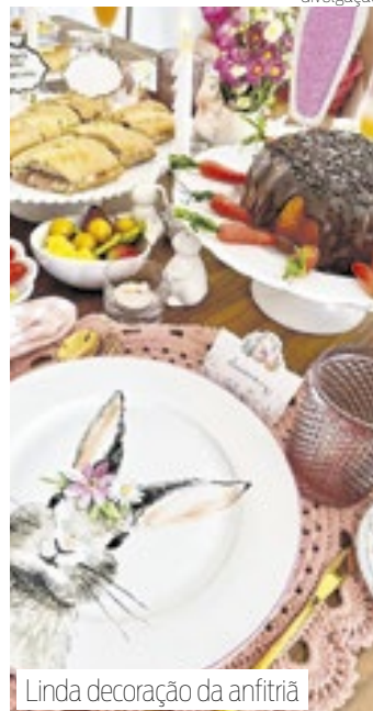
Linda decoração da anfitriã