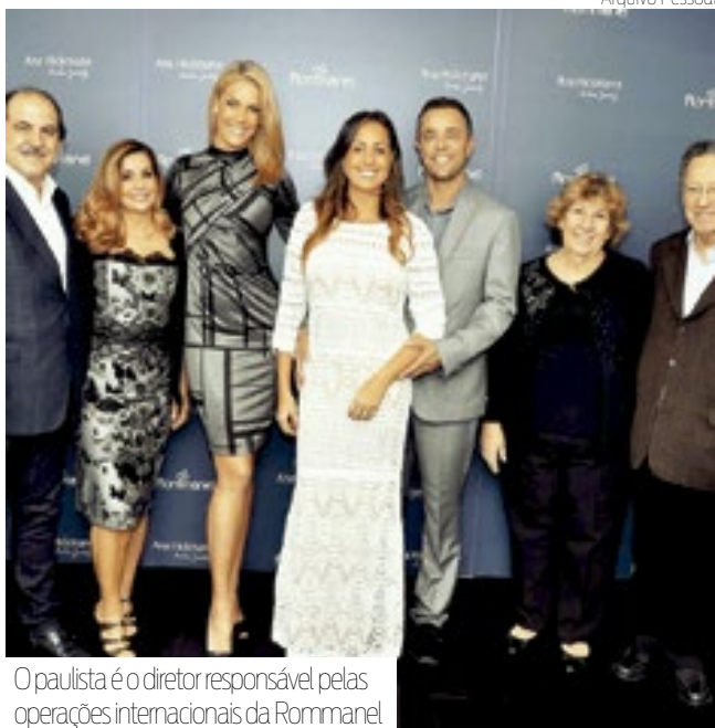
O paulista é o diretor responsável pelas operações internacionais da Rommanel

Há mais de duas décadas fora do Brasil, executivo paulistano lidera as operações internacionais da Rommanel nos Estados Unidos e defende que resiliência, adaptação cultural e relações humanas são pilares do sucesso empresarial