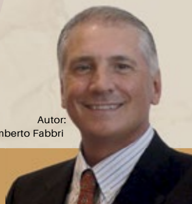
Autor: Umberto Fabbri

Disponível impresso e em eBook nos sites Amazon.com, Barnes&Noble.com e Books&Books.com