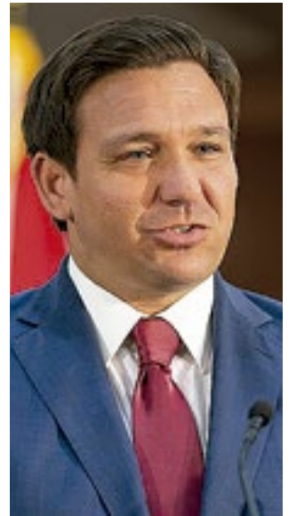
Ron DeSantis, governador da FL