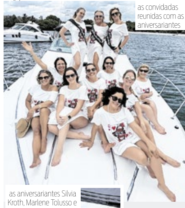
as convidadas reunidas com as aniversariantes