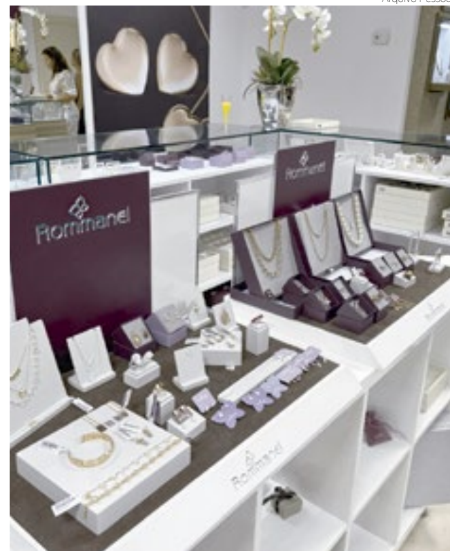
A Rommanel é uma das maiores marcas brasileiras do segmento de joias