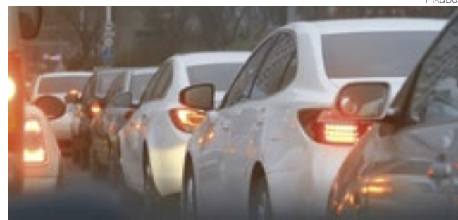
Equipamentos identificam horário, local e movimentação dos carros

que não compartilha dados com autoridades federais de imigração. A Lowe's disse que só fornece informações quando há obrigação legal. Mesmo assim, a denúncia reacendeu o debate sobre vigilância digital e os limites do monitoramento em áreas privadas de grande