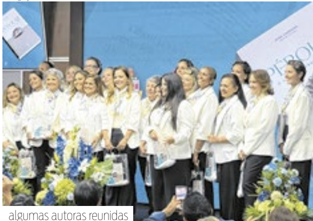
algumas autoras reunidas

Na noite de 16 de maio ocorreu o lançamento do livro "Pérolas, o valor da Transformação", uma obra escrita por 32 mulheres que compartilham histórias de fé, coragem e força, diante do diagnóstico de câncer. O evento reuniu algumas autoras e seus amigos e familiares, em Lighthouse Point. A venda deste livro não tem fins lucrativos, pois será revertida para ações de apoio a outras mulheres com o mesmo diagnóstico.