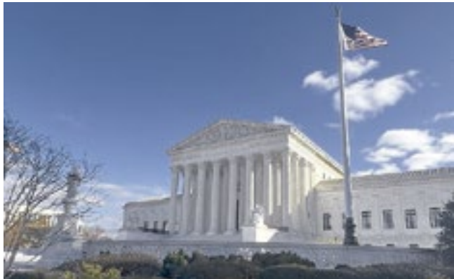
Suprema Corte dos EUA

Trump citou Neil Gorsuch e Amy Coney Barrett, nomeados por ele no primeiro mandato, ao criticar decisões recentes da Corte. Ele reclamou do julgamento de fevereiro que limitou sua política tarifária e afirmou que não vê problema em magistrados demonstrarem lealdade ao presidente que os escolheu. "Eles têm