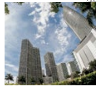
Prédios em Miami, FL

Segundo a petição, a área deixou de atender estudantes e a comunidade de Downtown Miami para servir a interesses privados ligados a Trump. O processo afirma ainda que o local pode receber um hotel de luxo, ampliando a vantagem econômica ao ex-presidente. A transferência foi autorizada por DeSantis em se-