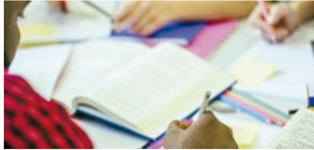
Broward e Miami-Dade contestam resultado

Na Flórida, porém, líderes de Broward e Miami-Dade