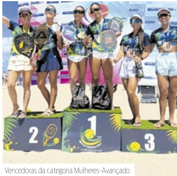
Vencedoras da categoria Mulheres-Avançado