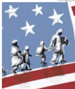
Milhões vivem indocumentados

O levantamento aponta que 36% das crianças afetadas têm menos de 6 anos. Mais da metade tem